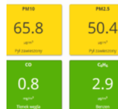
Stacja na ulicy Mikołaja Reja