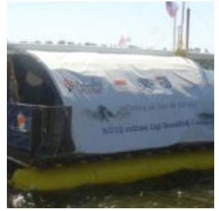
Fot. Krzysztof Wiśniewski.